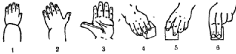
Рис. 3. Этапы развития функций кисти руки ребенка: 1 - положение кисти в 16 недель, 2 и 3 - в 56 недель, 4 - в 60 недель, 5 - в 3 года, 6 - взрослый.

Случайность ли, что тренировка пальцев рук влияет на созревание речевой функции? В электрофизиологическом исследовании, проведенном Т. П. Хризман и М. И. Звонаревой, было обнаружено, что, когда ребенок производит ритмические движения пальцами, у него резко усиливается согласованная деятельность лобных и височных отделов мозга.