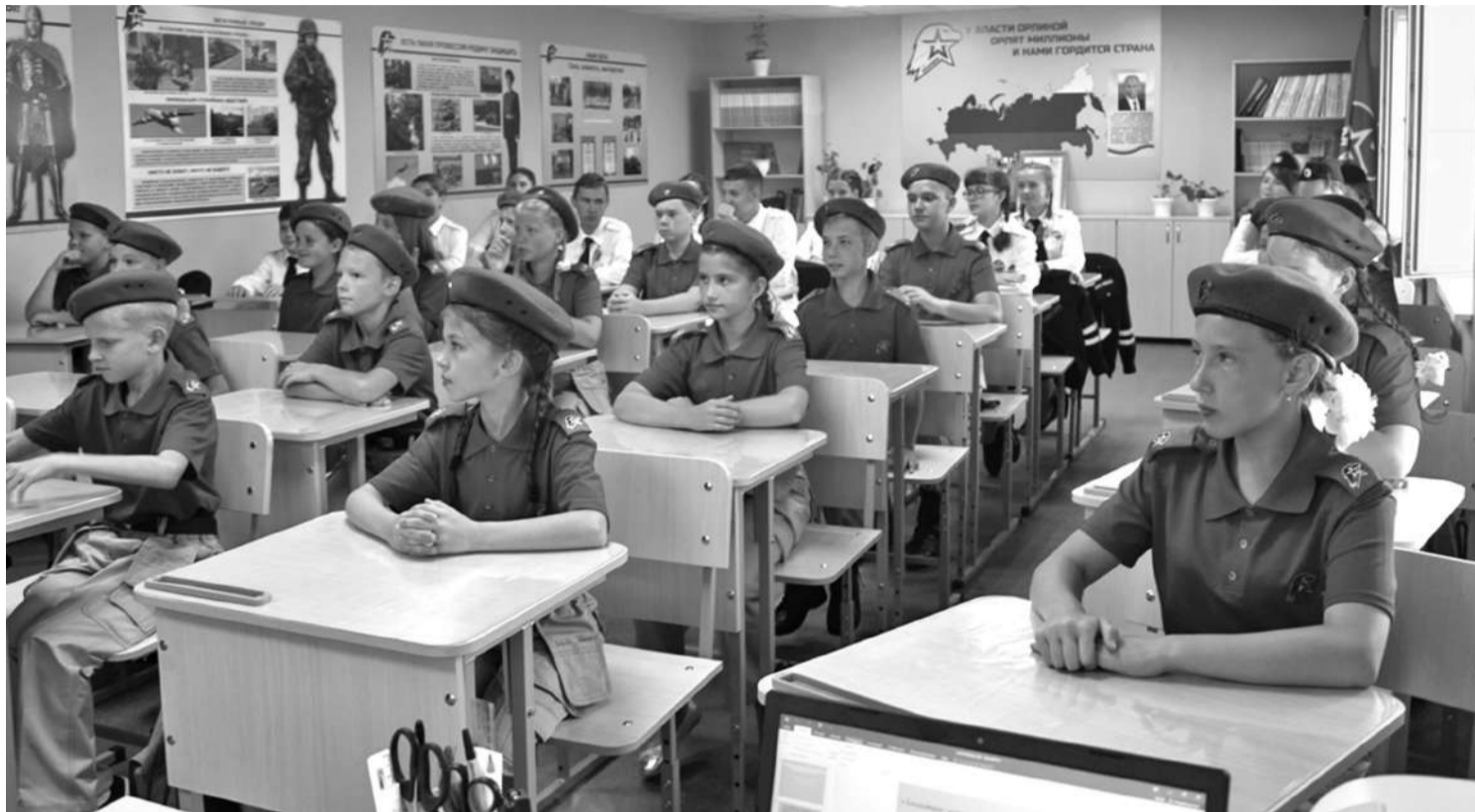
Кадетский класс школы № 1

В результате реализации проекта в школе создали лабораторию, которую можно без преувеличения назвать кузницей пытливых, талантливых юных исследователей. Ученики от четвёртого до выпускного классов занимаются наукой. В рамках постпроектной деятельности рядом с лабораторией оформлена развивающая зона «Химия занимательная и увлекательная», которая рассказывает об опытах,