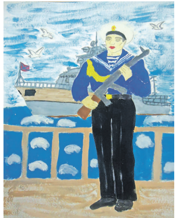
Моряк. Рисунок Анатолия Черняева (Графовская школа Шебекинского горокруга)

Ульяна Самаль, ученица Бессоновской школы Белгородского района